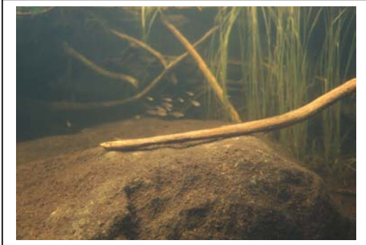
Taux de phosphore de 4ug/L