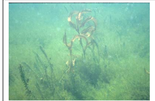
Taux de phosphore de 8ug/L